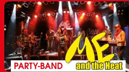
PARTY-BAND and the Heat