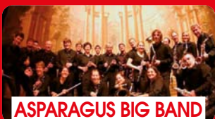
ASPARAGUS BIG BAND