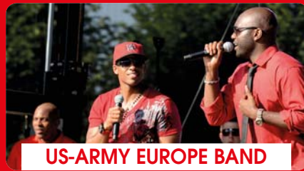
US-ARMY EUROPE BAND