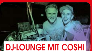
DJ-LOUNGE MIT COSHI