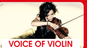
VOICE OF VIOLIN